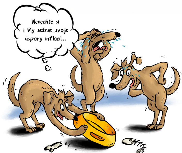
ČÁSTKA NA BĚŽNÉM ÚČTĚ, ČI DOMA 100.000,-

V prvním čtvrtletí roku 2022 se očekává meziroční inflace k 8%, možná až k 10%. Potom ekonomové předpokládají, že by inflace mohla klesat. Pro ochranu financí proti inflaci dnes existuje řada nástrojů. Ať jsou to různé typy dluhopisů, nemovitostní fondy či komodity. Rádi vám v tom poradíme.